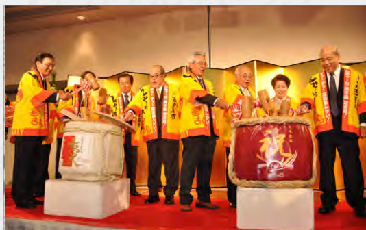
宮古島市新春の集い (1/6)