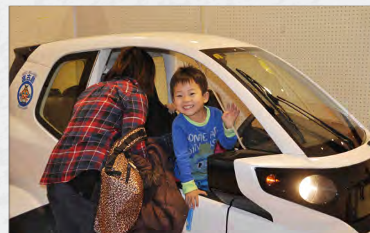
県民環境フェア in 宮古島 (1/18)