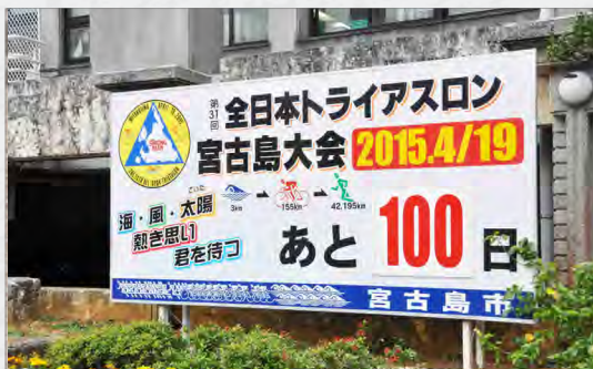
平良庁舎にトライアスロン残歴板 (1/9)