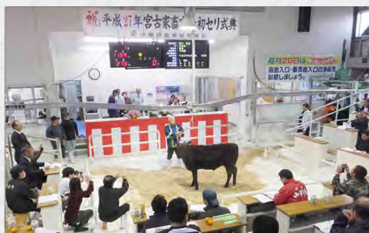
宮古家畜市場初セリ式典 (1/19)