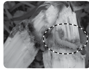
△イネヨトウに 加害されたキビ

人工的に合成した性フェロモン剤を詰めたいも状のチューブを、さとうきび畑などに設置し、一帯にフェロモンを充満させることによって、イネヨトウの交尾を阻害し、次世代の密度を低下させます。一斉に広範囲に設置することで高い効果を発揮します。