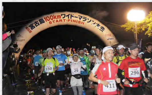
宮古島 100 km ワイドマラソン (1/11)